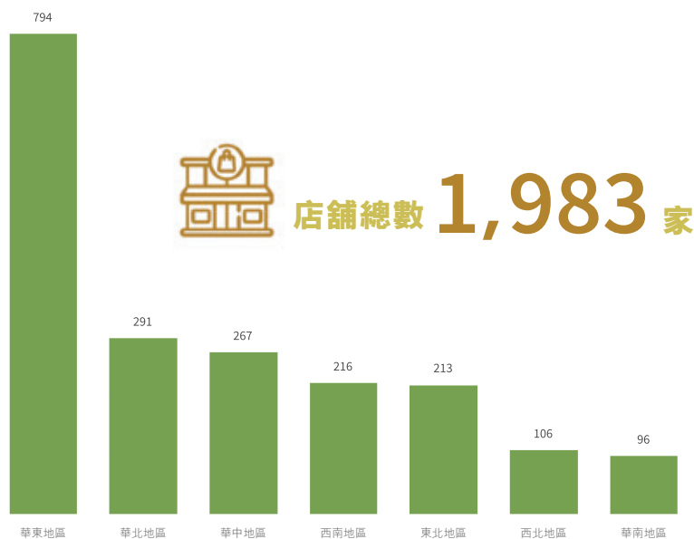
中國內地城市層級店舖及零售額分佈