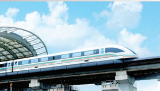
軌道交通解決方案