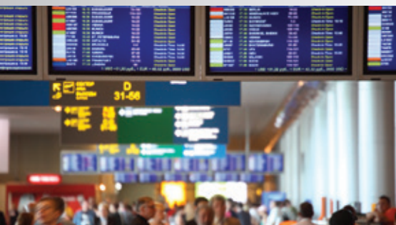
機場航顯解決方案