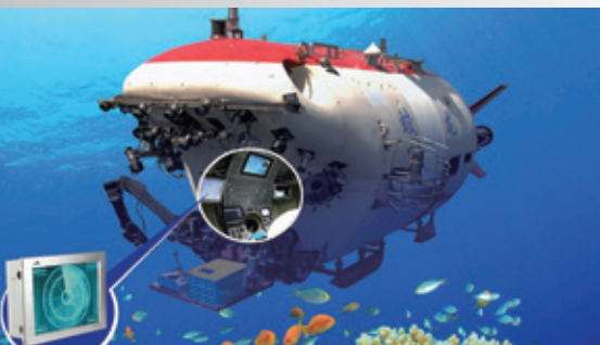
綜合顯控系統解決方案