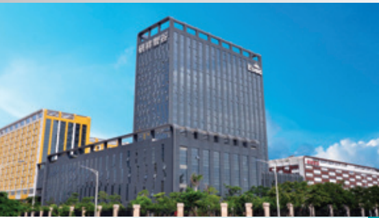
光明新區之研發大樓