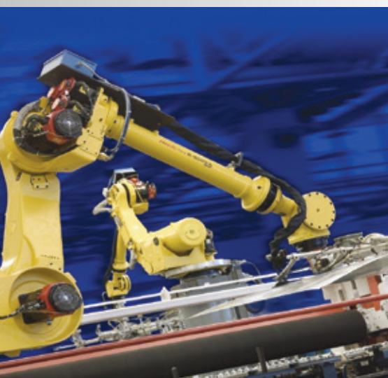
自動化生產線解決方案