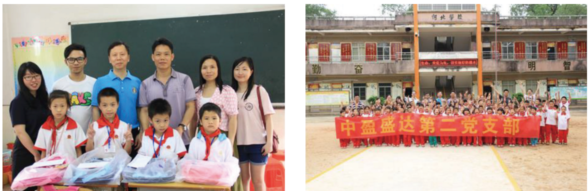
「暖春送愛心，陽光助學行」愛心行動。