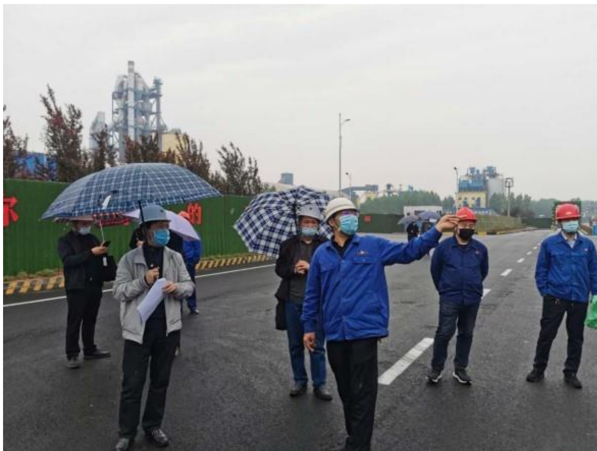
許昌市生態環境保護局對禹州公司清潔生產開展情況進行審核驗收

窯內燃燒煤炭及其他消耗電能的器具設備亦分別直接及間接產生溫室氣體排放。故此本集團採取措施降低碳排放量，例如使用已經過煨燒的鈣質原料、降低每年度用煤量。本集團根據國家及各省市發改委政策及協力廠商核查機構要求識別碳排放源，並根據相關碳排放政策及計算方法計算碳排放量，又制定了可量化的減碳目標，在生產運營中落實，對於問題專案和不完善做法進行分析糾正，定期評估減碳成效。例如集團旗下光山分公司以噸熟料二氧化碳排放量降低 5% 為目標。