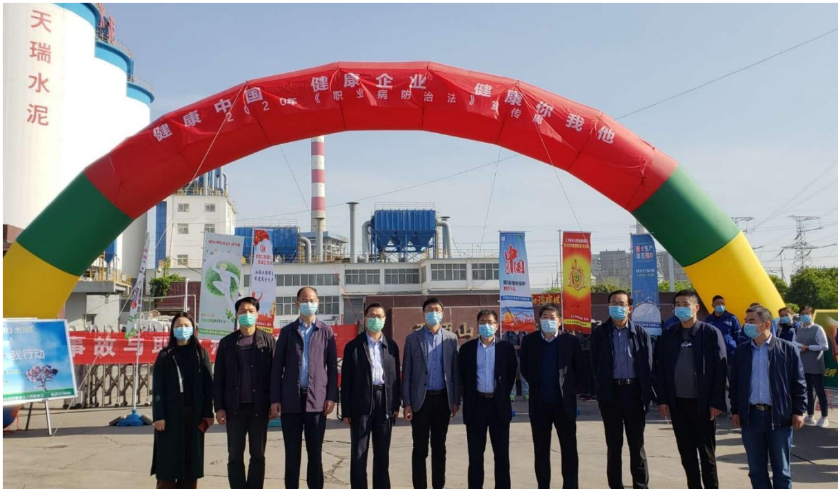
《職業病防治法》宣傳周

年內新型冠狀病毒肺炎在全球大流行，本集團加強措施應對復工復產時帶來的傳染病風險。一般新型冠狀病毒肺炎事件應急處置措施主要包括：