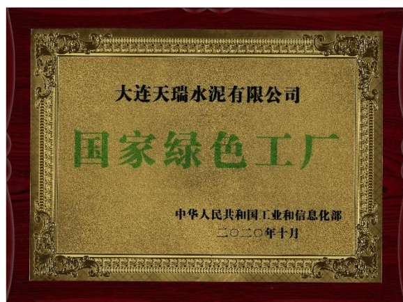
國家綠色工廠榮譽