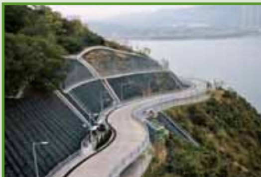
將軍澳接連墳場道路 電氣及消防設備之安裝工程 Footpath Linking Junk Bay Chinese Permanent Cemetery Building Services Installation (Electrical & Fire Services)