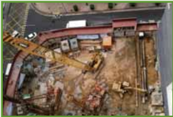
香港荃灣灰瑤角街2-6號 總承包工程，二十一層高工廠大樓 (包括樁基礎及上蓋、機電及裝修工程) No.2-6 Fui Yiu Kok Street, Tsuen Wan, Hong Kong Main Contractor for redevelopment a 21-storey industrial building including construction of sub-structure and superstructure, E&M and fitting out works