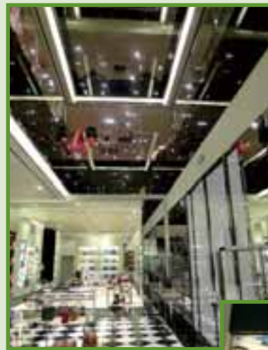
中國浙江省 杭州國際名品街PRADA 店舖裝修工程 PRADA at Hangzhou Euro Street, Zhejiang Province, China Shop fitting out works