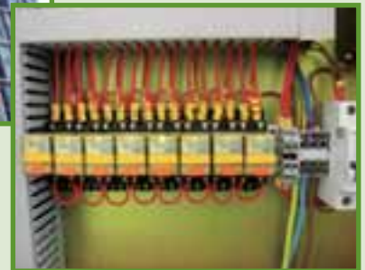
香港城市大學 ~ 學生宿舍第4期 電氣、空調及消防設備之安裝工程 City University of Hong Kong ~ Student Hostel Development Phase IV Building Services Installation (Electrical, HVAC & Fire Services)