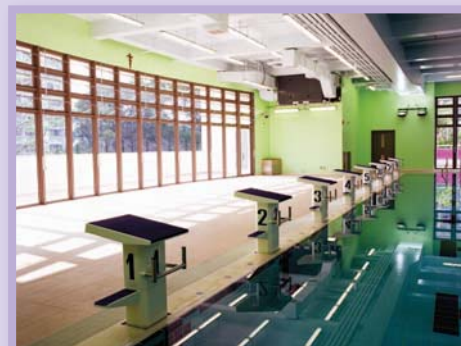
香港牛池灣德望學校(小學部) Good Hope School, Ngau Chi Wan, Hong Kong (Primary Section)