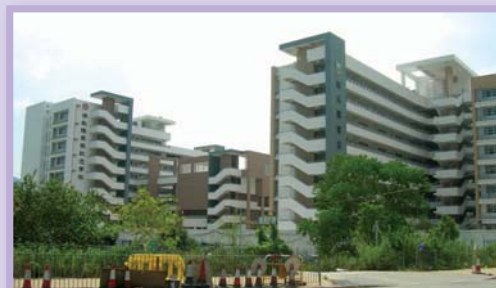
元朗13區兩所小學 提供屋宇設備裝置工程 Two Primary Schools in Area 13, Yuen Long Building Services Installation